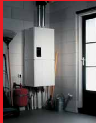
EcomLine Classic HR Combi 22 of 30 met ingebouwde 25 liter boiler (verticale uitvoering).

Beide boilers kunnen ook worden gecombineerd met de EcomLine Classic HR 43.