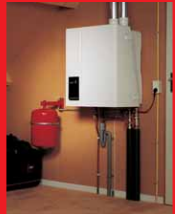
EcomLine Classic HR 22 of 30.