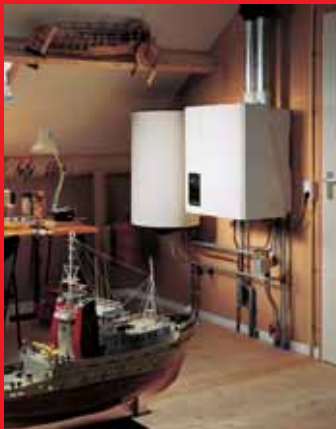
EcomLine Classic HR 22 of 30 met 80 liter boiler. Er is ook een 120 liter boiler.

Beide boilers kunnen ook worden gecombineerd met de EcomLine Classic HR 43.