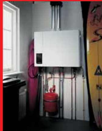
EcomLine Classic HR Combi 22 of 30 met ingebouwde 25 liter boiler (horizontale uitvoering). Een EcomLine Classic HR 43 of 65 (zonder boiler) ziet er hetzelfde uit.